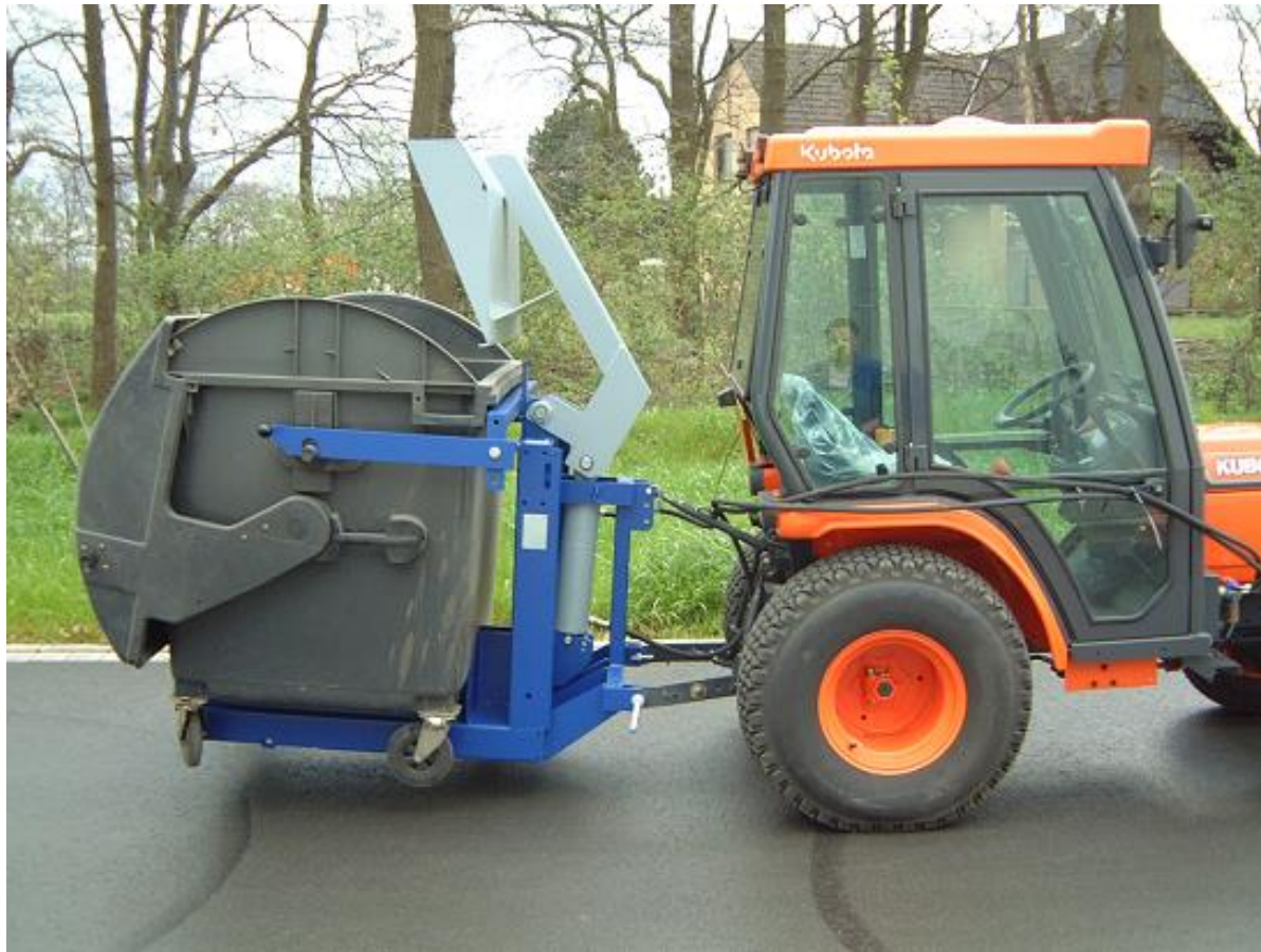
Мобильное использование контейнерного пресса путем подключения к трактору.